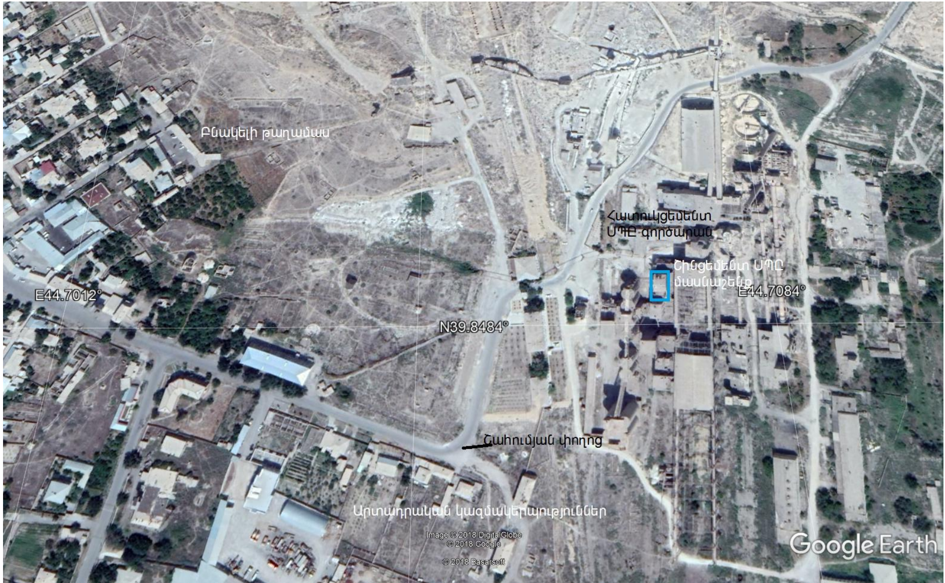
Նկար 2. Տեղանքի իրավիճակային քարտեզ