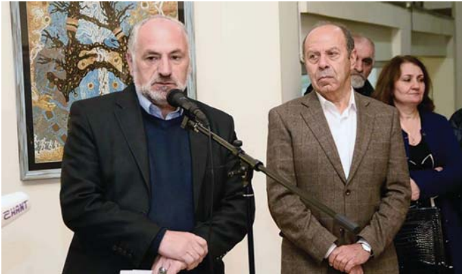
«ԽՈՍՐՈՎԻ ԱՆՏԱՌ. ԱՅԱԶԱՆԳ ԵՎ ՎԵՐԱԾՆՈՒՄՆԵՐ» խորագրով ցուցահանդեսը Նկարիչների միությունում

Նոյեմբերի 14-ին Հայաստանի նկարիչների միությունում բացվեց «ԽՈՍՐՈՎԻ ԱՆՏԱՌ. ԱՅԱԶԱՆԳ ԵՎ ՎԵՐԱԾՆՈՒՄՆԵՐ» խորագրով ցուցահանդեսը: Նկարիչների աշխատանքներն արվել են «ԽՈՍՐՈՎԻ ԱՆՏԱՌ» պետական արգելոցում: Մտահղացումն ու իրագործումը ՀՀ բնապահպանության նախարարությանն ու Հայաստանի նկարիչների միությանն էր: Ներկայացվել են շուրջ 80 աշխատանքներ, որոնք «Խոսրովի անտառ» պետական արգելոց այցելությունների արդյունքն են և պատկերում են «Խոսրովի անտառ» պետական արգելոցի հրաշագեղ բնությունն ու, միաժամանակ, անդրադառնում այս տարվա օգոստոսին արգելոցում բռնկված սաստիկ հրդեհից տուժած տարածքներին: Հանդիսավոր բացմա-