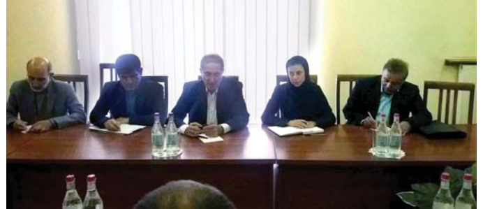
Գործնական հանդիպում Իրանի Իսլամական Հանրապետության պատվիրակության հետ

Հայաստանի Հանրապետության և Իրանի Իսլամական Հանրապետության Միջկառավարական հանձնաժողովի 14-րդ համատեղ նիստի Փոխընթացման հուշագրի կատարման ընթացքը վերահսկող հանձնախմբի նիստի շրջանակներում Հայաստան ժամանած Ալիռեզա Դաեմիի հետ քննարկվել են բնապահպանության ոլորտում կարճաժամկետ և երկարաժամկետ համագործակցությանը վերաբերող մի շարք հարցեր՝ մասնավորապես անդրադարձ կատարելով Փոխընթացման հուշագրի կետերով նախանշված գործողություններին և դրանց իրականացման ժամկետներին: Փաստաթղթի շրջանակներում իրանական կողմը բարձրաձայնել է Ազարակի պղնձամոլիբդենային կոմբինատի կողմից Արաքս գետի աղտոտման խնդիրը և կեղտաջրերի շրջանառու փակ համակարգի ներդրման ժամանակացույցին վերաբերվող հարցեր: